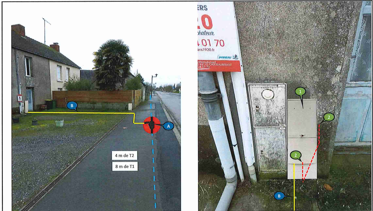
La solution technique est déterminée dans le respect de la norme NFC 14-100 en vigueur. Photo compteur non contractuelle