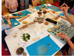
Atelier Coupelles de germination en février

Tout public dès 8 ans, atelier Cadavre-exquis (jeu d'écriture ou de dessin à plusieurs).